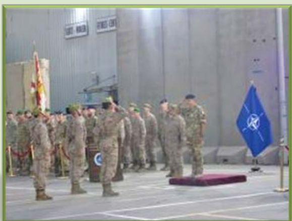
Relevo de la Unidad de Force Protection (UFP A/I)