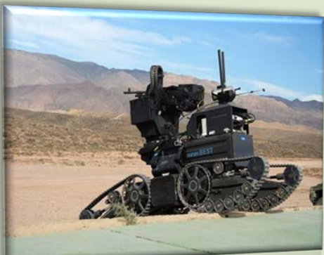
Un robot en su demostración de capacidades