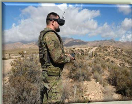
Un militar maneja un dron táctico