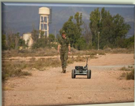
Un militar guía un robot terrestre ligero

El Ejército de Tierra ha realizado un ejercicio, del 27 al 31 de octubre, en el Campo de Maniobras y Tiro "Álvarez de Sotomayor" (Almería), donde se han integrado sistemas robotizados, en el marco de la Campaña de Experimentación Táctica 2025, organizada por el Centro de Fuerza Futura 2035 de la División de Planes del Estado Mayor del Ejército, con la colaboración de la Brigada "Rey Alfonso XIII" II de la Legión como Brigada Experimental.