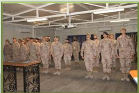
Relevo del Elemento de Apoyo Nacional (NSE)

Dos unidades españolas, desplegadas en la base de Union III, en Bagdad, han realizado el relevo de mando.; Por un lado, el jefe de la Unidad de Force Protection (UFP) A/I XXII, ha cedido el mando al nuevo jefe que lidera la UFP A/I XXIII. Por otro lado, se ha realizado el relevo del mando del Elemento de Apoyo Nacional (NSE) del contingente español.