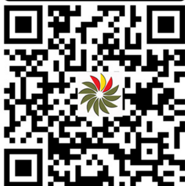
Tu DIAPER (IOS)